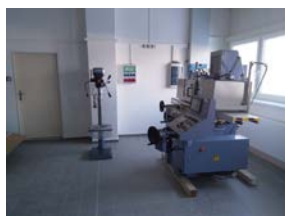
Werkstatt - Gebäude