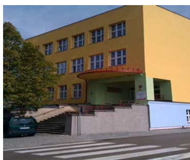
Schulgebäude 2 Miřiovského 678