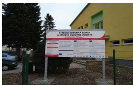
Halle der Praxis und der praktischen Ausbildung Nový Dvůr