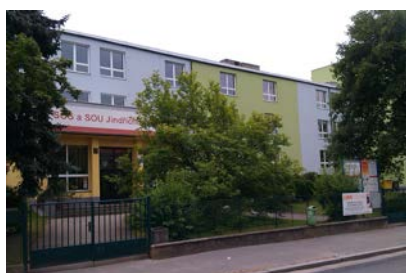
Sitz der Schule-Schulgebäude Jáchymova 478