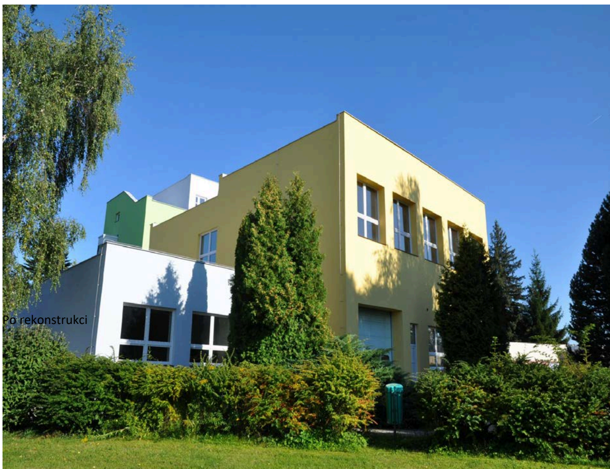
Dokončená rekonstrukce – současný stav