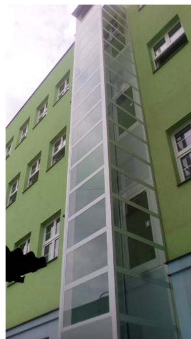
Bezbariérový výtah (2018)