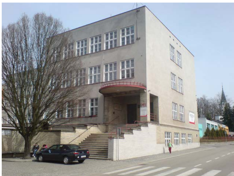
Vzhled před rekonstrukcí