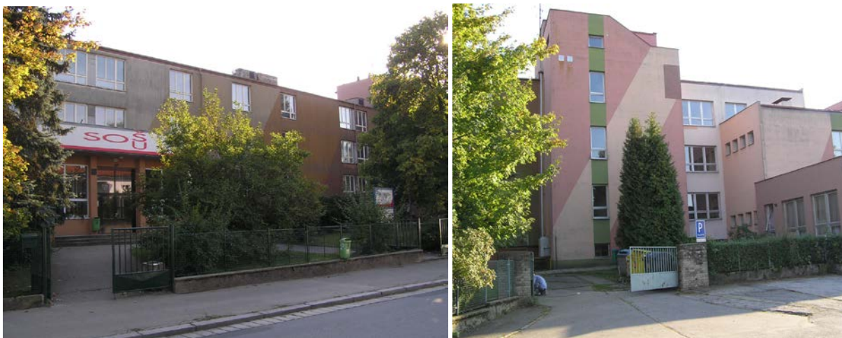
Vzhled před rekonstrukcí